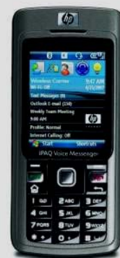
HP iPAQ 514 Voice Messenger

* Le stockage peut être facilement étendu.